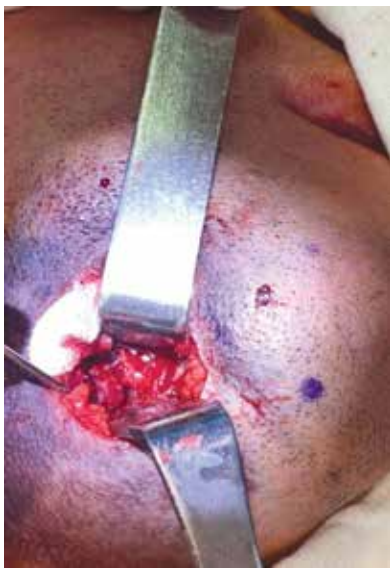
Рис. 5. Інтеропераційна фотографія підщелепного відділу справа. Кульове сліпе поранення м'яких тканин дна нижньої щелепи в ментальному відділі справа. Дефект кісткової тканини нижньої щелепи у ділянці тіла щелепи справа та ментального її відділу. Післяопераційна рана розташована в місці формування гематоми дна порожнини рота