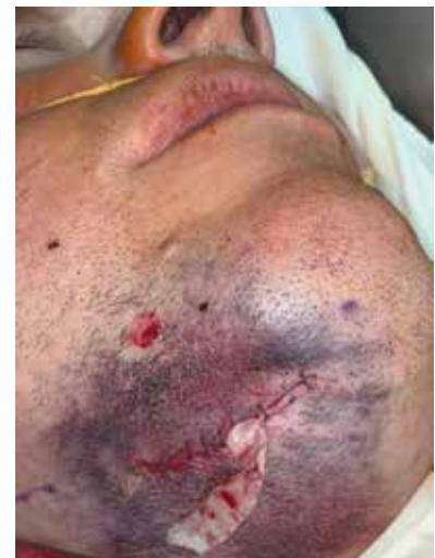
Рис. 7. Фотографія підщелепної ділянки справа після проведення ПХО ранового каналу в результаті кульового ураження нижньої щелепи справа. Гематома м'яких тканин, що утворилася в ділянці дна порожнини рота. Зверху від післяопераційної рани вхідний отвір пулі, розміри якого співпадають з калібром кулі. Після проведеної ПХО в рані залишений дренаж. Рана частково ушита