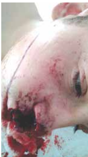
Рис. 1. а. Зовнішній вигляд хворого після вогнепального ураження нижньої та верхньої щелепи, наскрізне з ушкодженням дна ротової порожнини, ментального відділу нижньої щелепи, дефектом альвеолярного відростка нижньої щелепи, ушкодженням верхньої щелепи у фронтальному відділі з дефектом кісткової тканини альвеолярного відростка верхньої щелепи, дефект м'яких тканин верхньої губи, передсинку ротової порожнини верхньої щелепи та крила носа справа

Таким чином, вогнепальні поранення щелепно-лицевої ділянки в зв'язку з величезною пошкодження вимагають специфічного підходу в діагностиці та лікуванні. Впрова-