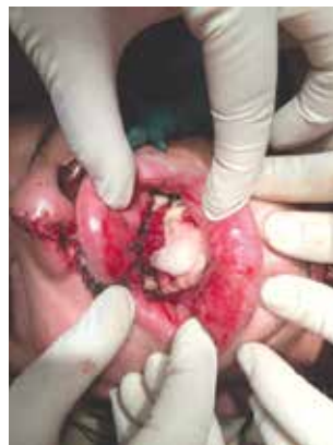
Рис. 3. Результат ПХО вогнепальної рани передсінку верхньої щелепи у фронтальному відділі з дефектом альвеолярної кістки, проведено повну ізоляцію кісткової рани альвеолярної частини верхньої щелепи без дренажування в ротову порожнину