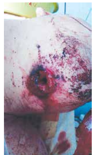
Рис. 1. б. Вхідний отвір в підпідборідній області внаслідок поранення з дробовою мисливської рушниці при суїцидальній спробі. Проникне ураження дна порожнини рота з проникненням до ротової порожнини. Дефект м'яких тканин шкіри підпідборідкової ділянки, розтрощення м'яких тканин дна ротової порожнини